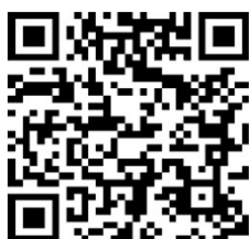
高知県糖尿病看護 土佐の会 プライバシーポリシー

テルモ株式会社 個人情報保護方針 https://www.terumo.co.jp/privacy_policy